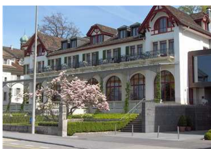
Panorama-Saal von aussen